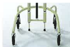
ストッパー 月額レンタル料 (B13)