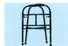
折りたたみ可能 月額レンタル料 (B14)

とにかく軽い、 マグネシウム製の 歩行器です。 一般的な歩行器より 1kg以上軽量です。