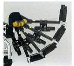
エレベーターテイング機能