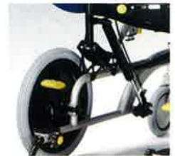
足踏み式パーキングブレーキ