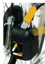
自動ブレーキ装置